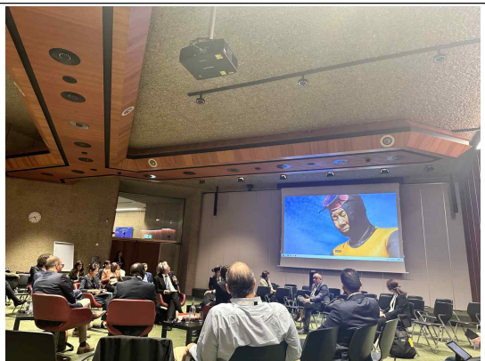
GBF목표 달성을 위한 지방정부의 기여(제주도)