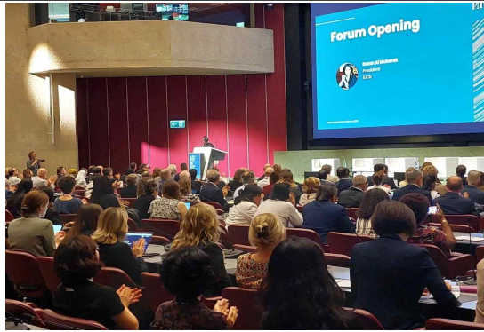
제2회 IUCN리더스포럼 개막식 (제네바)