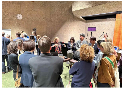
포럼 세션 단위 분임 토의