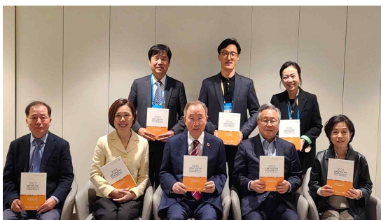
회원기관(에코맘코리아) 행사 참여