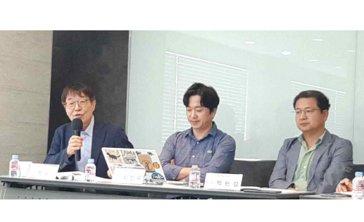
자연공존지역(OECM) 지역관계자 설명회